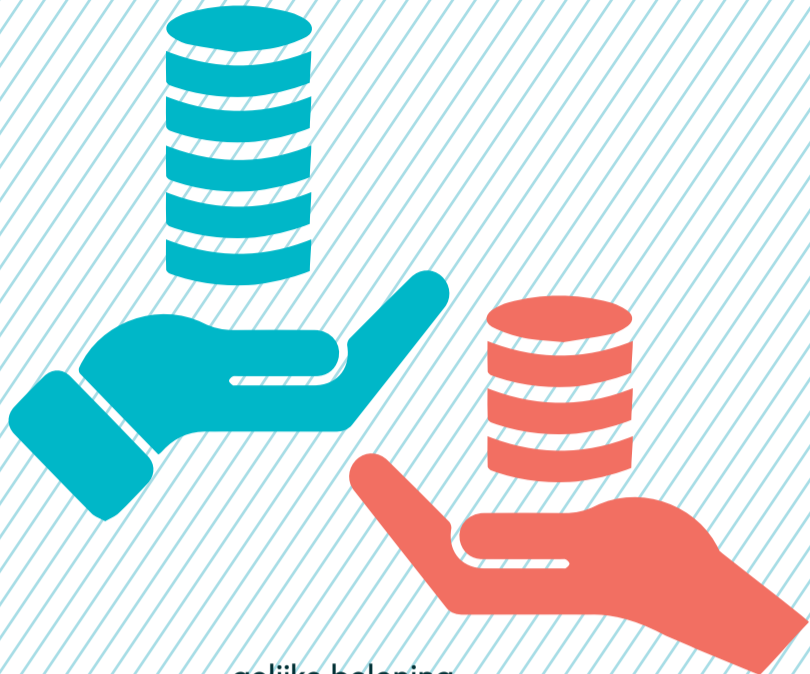
gelijke beloning (transparantie salarissen)

Volgens de Verenigde Naties (VN) is vrouwenparticipatie een belangrijke voorwaarde voor economische en sociale groei. Het is daarom niets voor niets een van de VN Duurzame ontwikkelingsdoelen: SDG 5 Gendergelijkheid voor iedereen. Toch krijgen vrouwen anno 2021 nog steeds minder ondersteuning voor financiële doeleinden dan mannen. Ook in Nederland. Dus beste regering, copy-paste erop los! Het is echt de allerhoogste tijd om gendergelijkheid een serieuze plek op de agenda te geven.