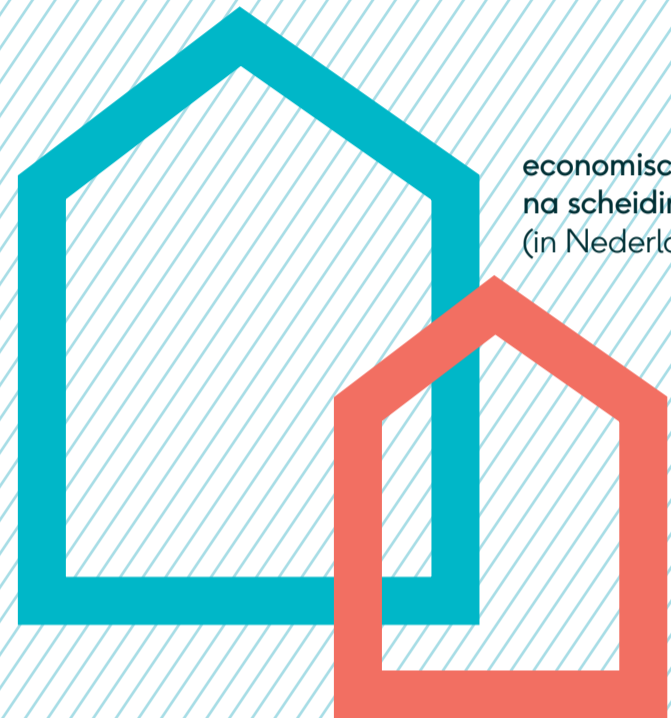
economische situatie na scheiding (in Nederland)