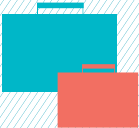
parttime werken na geboorte 1e kind (2018/19 in Nederland)